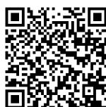
Садыхова Диана, 2 место (5-6 кл.)